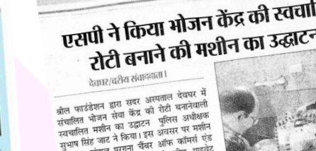
भोजन केंद्र की स्वचालित रोटी बनाने की मशीन का उद्घाटन