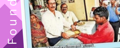
भोजन सेवा केंद्र की मनायी तृतीय वर्षगांठ