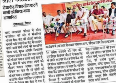
भोजन सेवा केंद्र की मनी वर्षगांठ