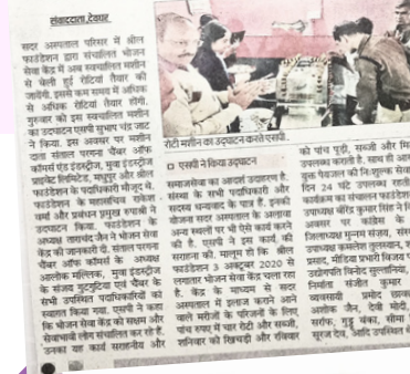
भोजन केंद्र में अब स्वचालित मशीन से तैयार होंगी रोटीयां

देवघर: सदर अस्पताल परिसर में संचालित भोजन सेवा केंद्र में अब स्वचालित मशीन से तैयार होंगी रोटीयां। भोजन सेवा केंद्र का स्थापना के पूर्व से जानता हूँ। इलाजगत मरीज निःशुल्क भोजन को मिलात प्रस्तुत